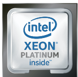
インテル® Xeon® スケーラブル・プロセッサ搭載